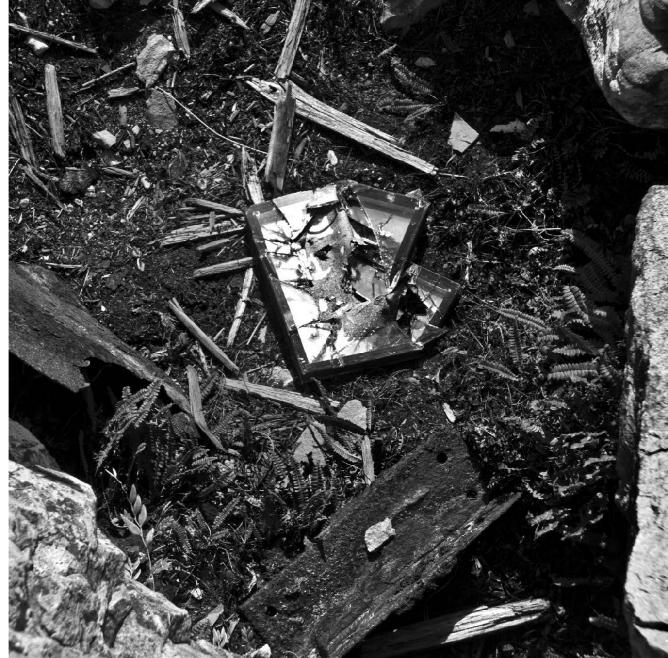
Recordatorio argentino vandalizado en cercanía a Monte Longdon