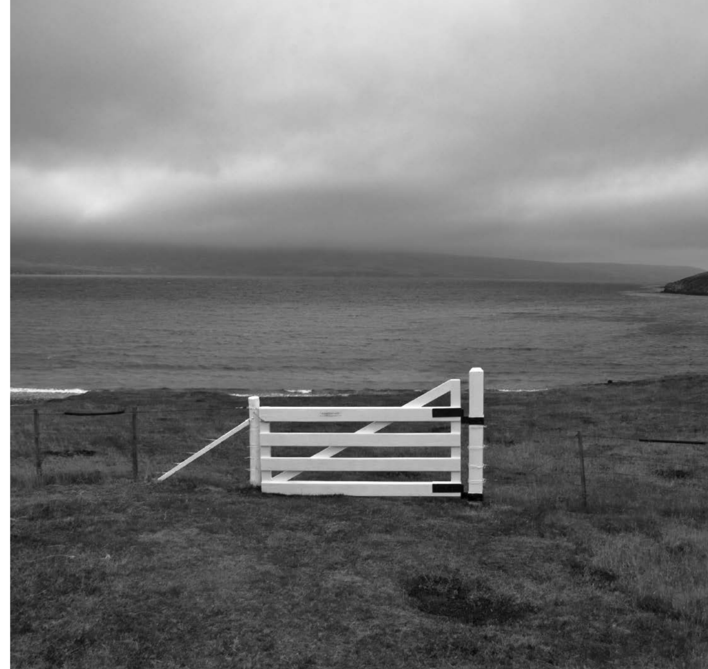
Der. Vista de Bahía San Carlos