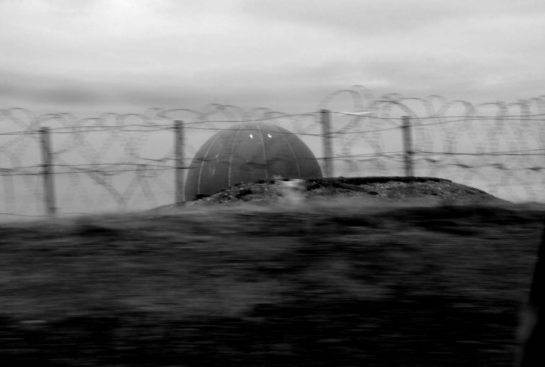
Campo minado cercano a monte Longdon