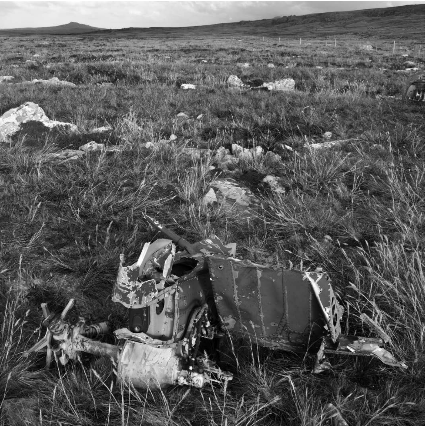
Restos de helicópteros en campo de batalla cercano a Puerto Argentino