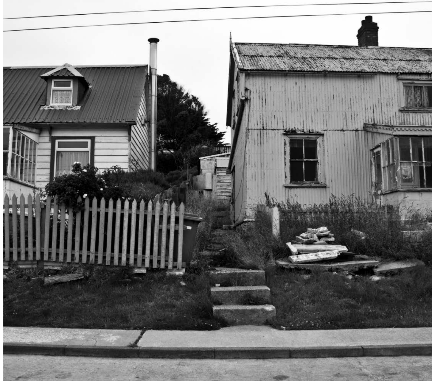
Izq. Viviendas de Puerto Argentino