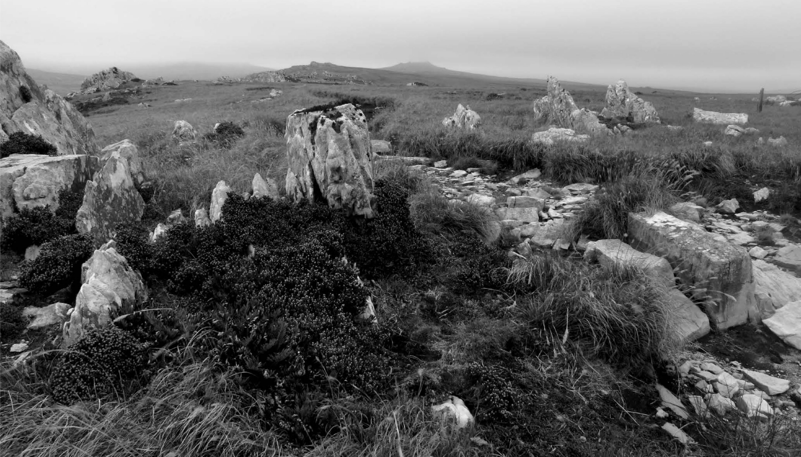
Cercanías de Moody Brook