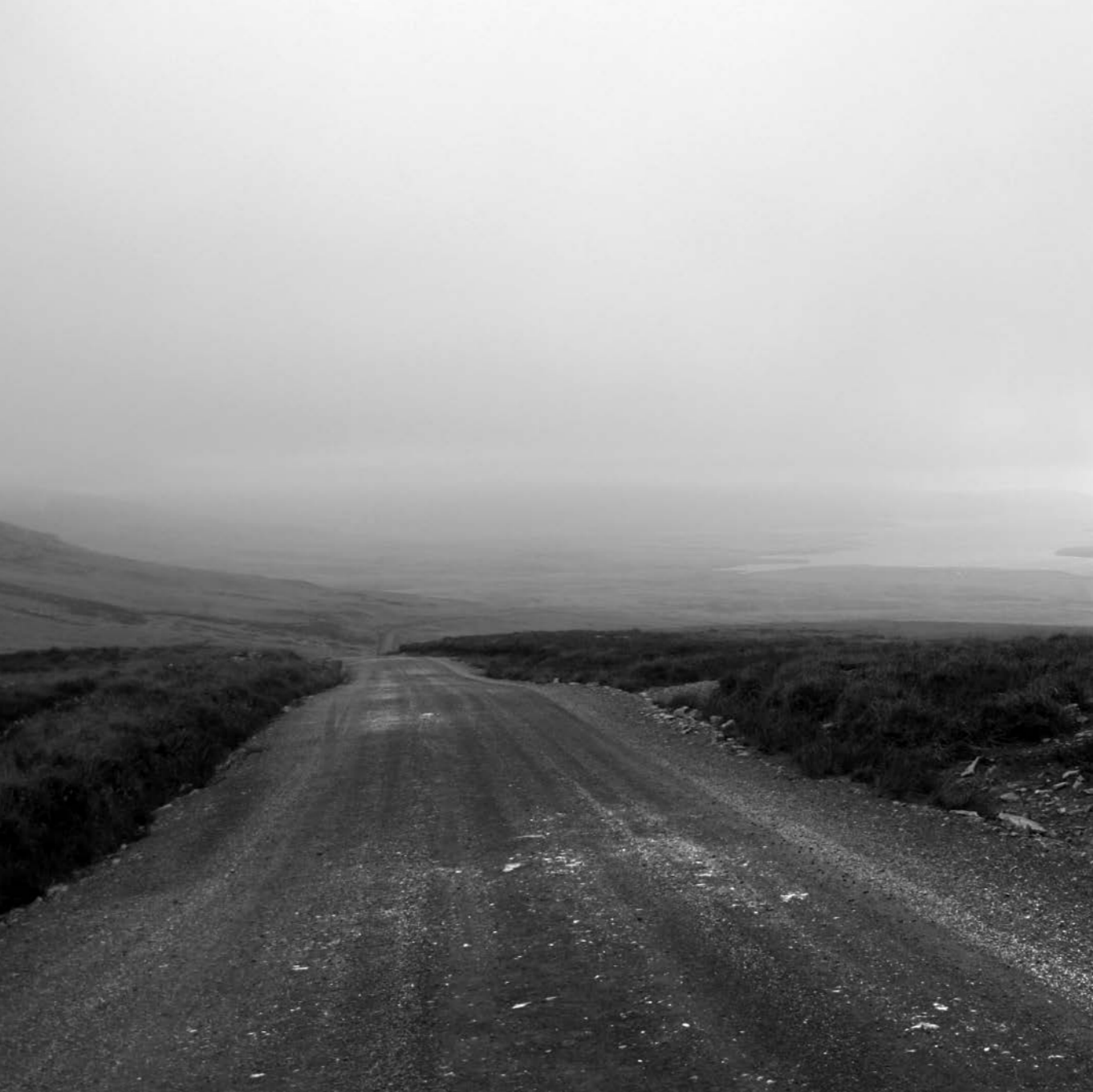
Camino de grava hacia Bahía San Carlos