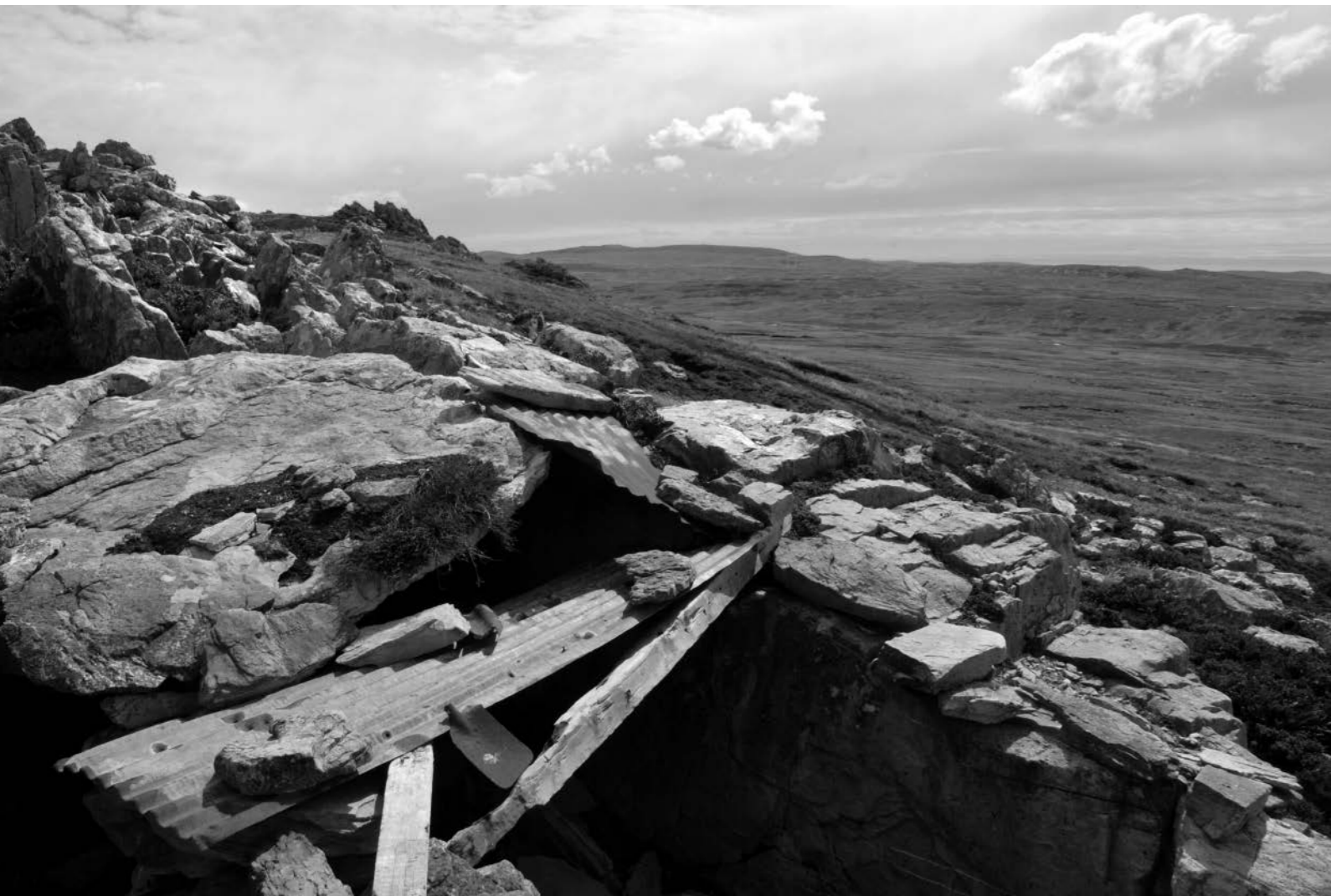
Resto de refugio cercano a Monte Longdon