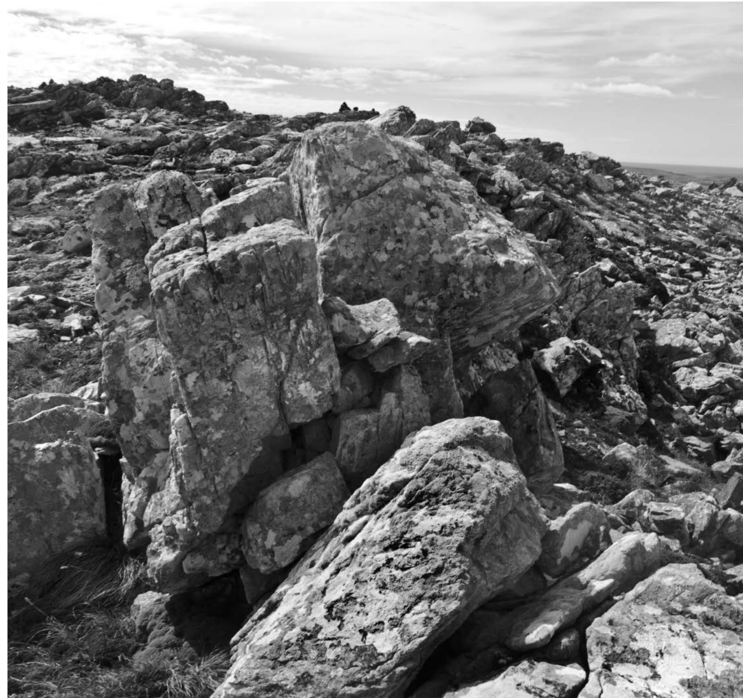
Piedras de Monte Longdon