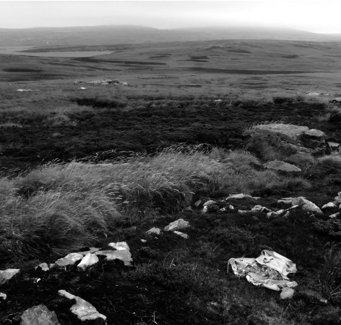
Vista de Moody Brook