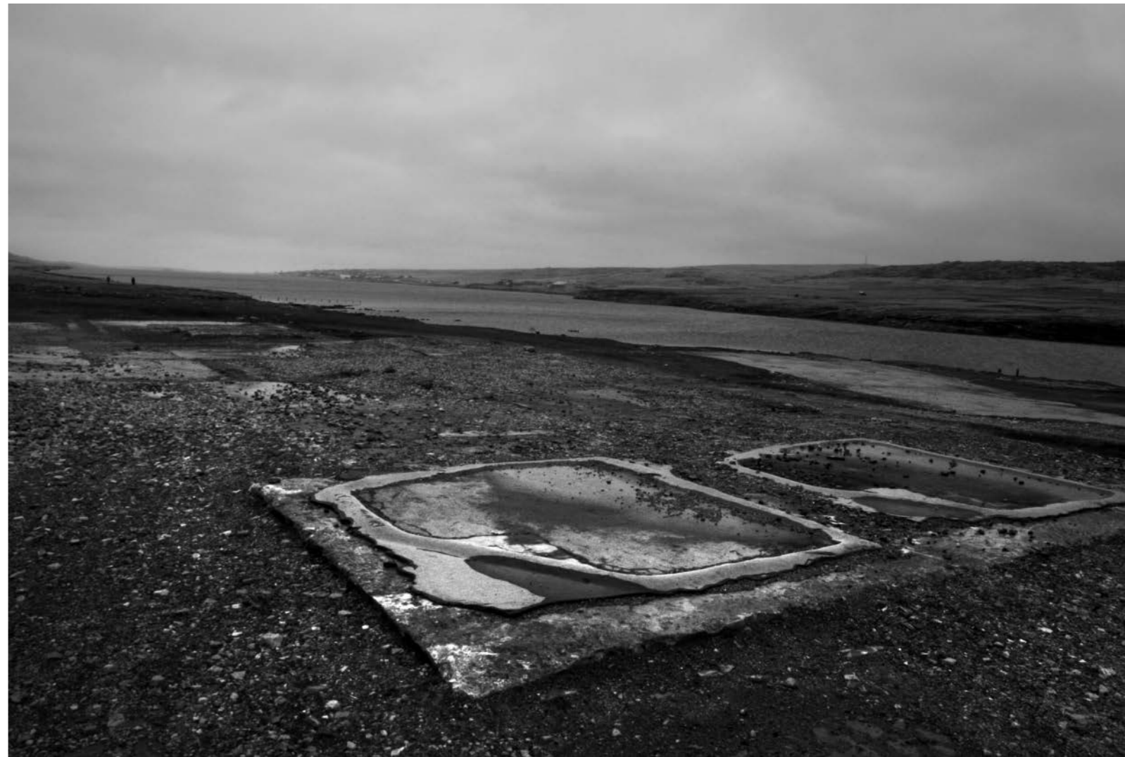
Restos ubicados en Moody Brook