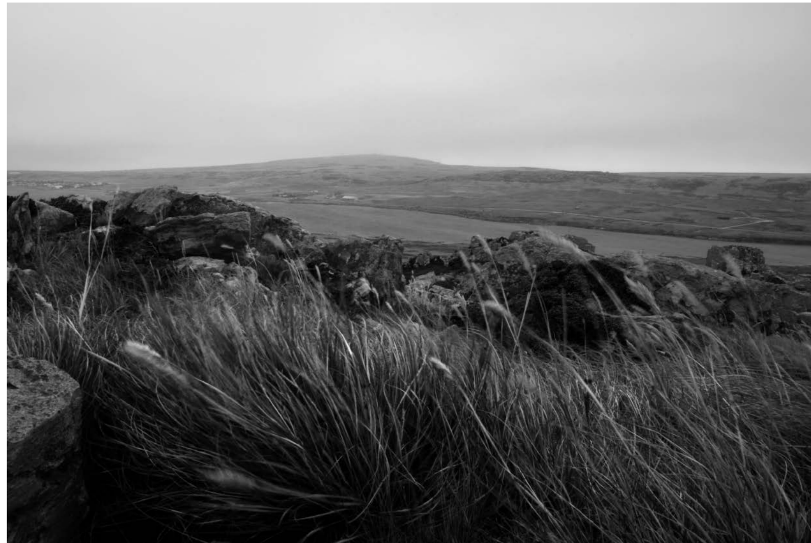
Izq. Vista Bahía San Carlos