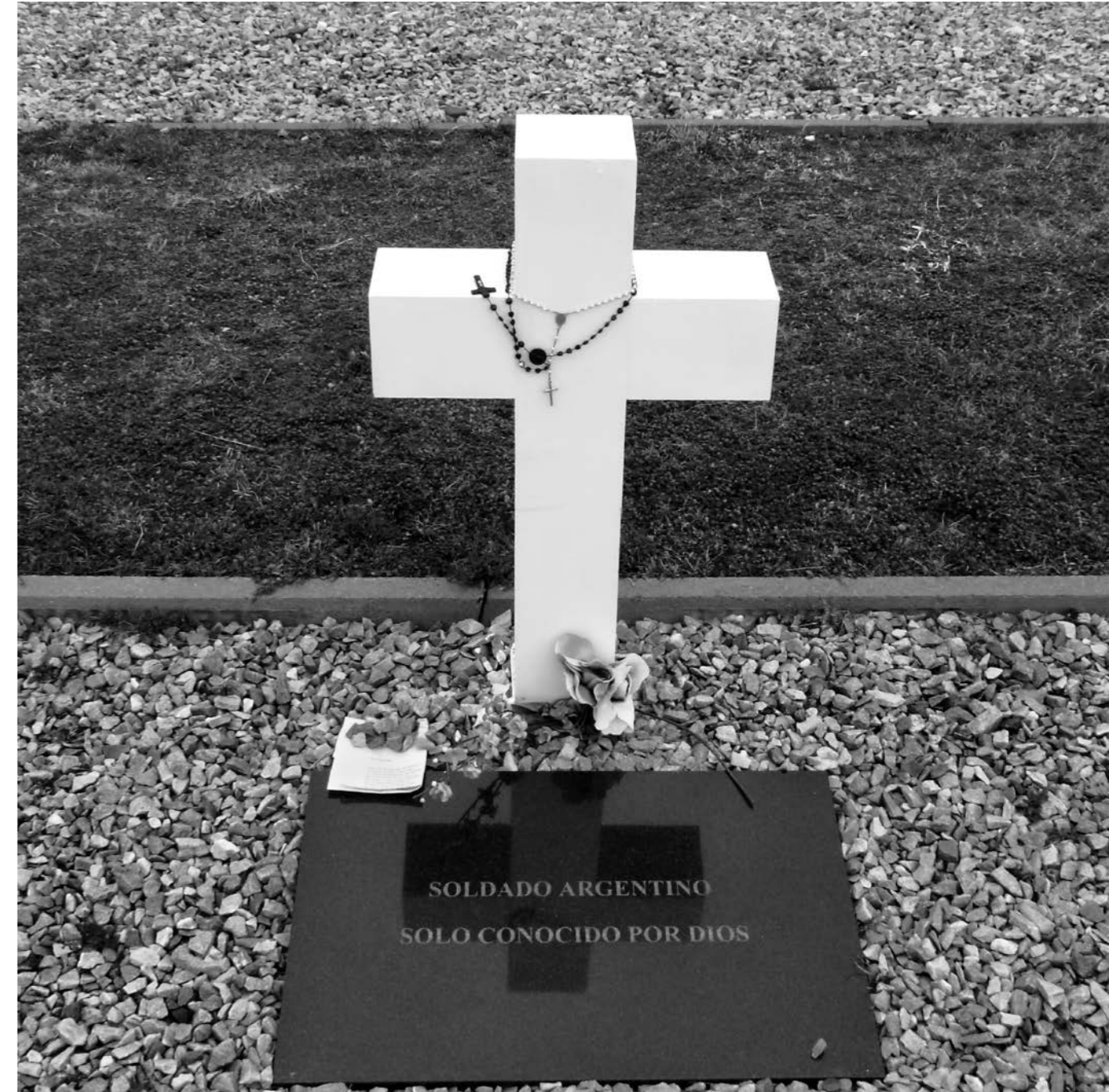
“Soldado solo conocido por Dios”