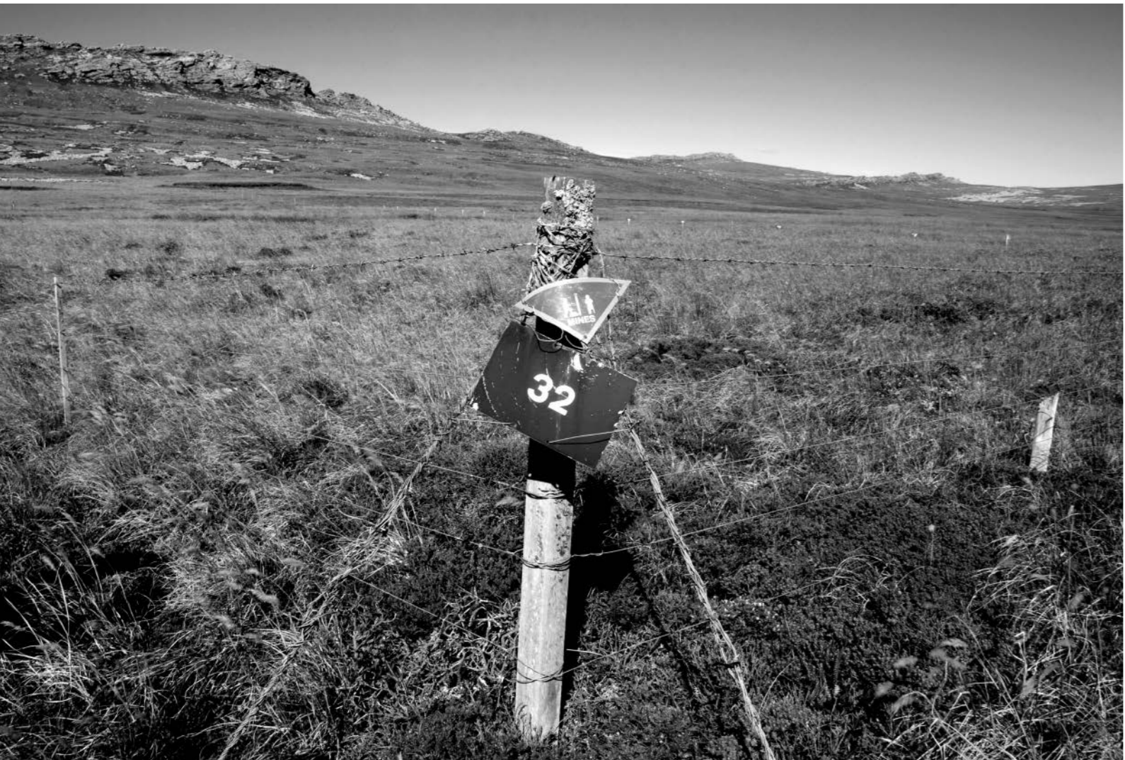
Campo minado cercano a monte Longdon