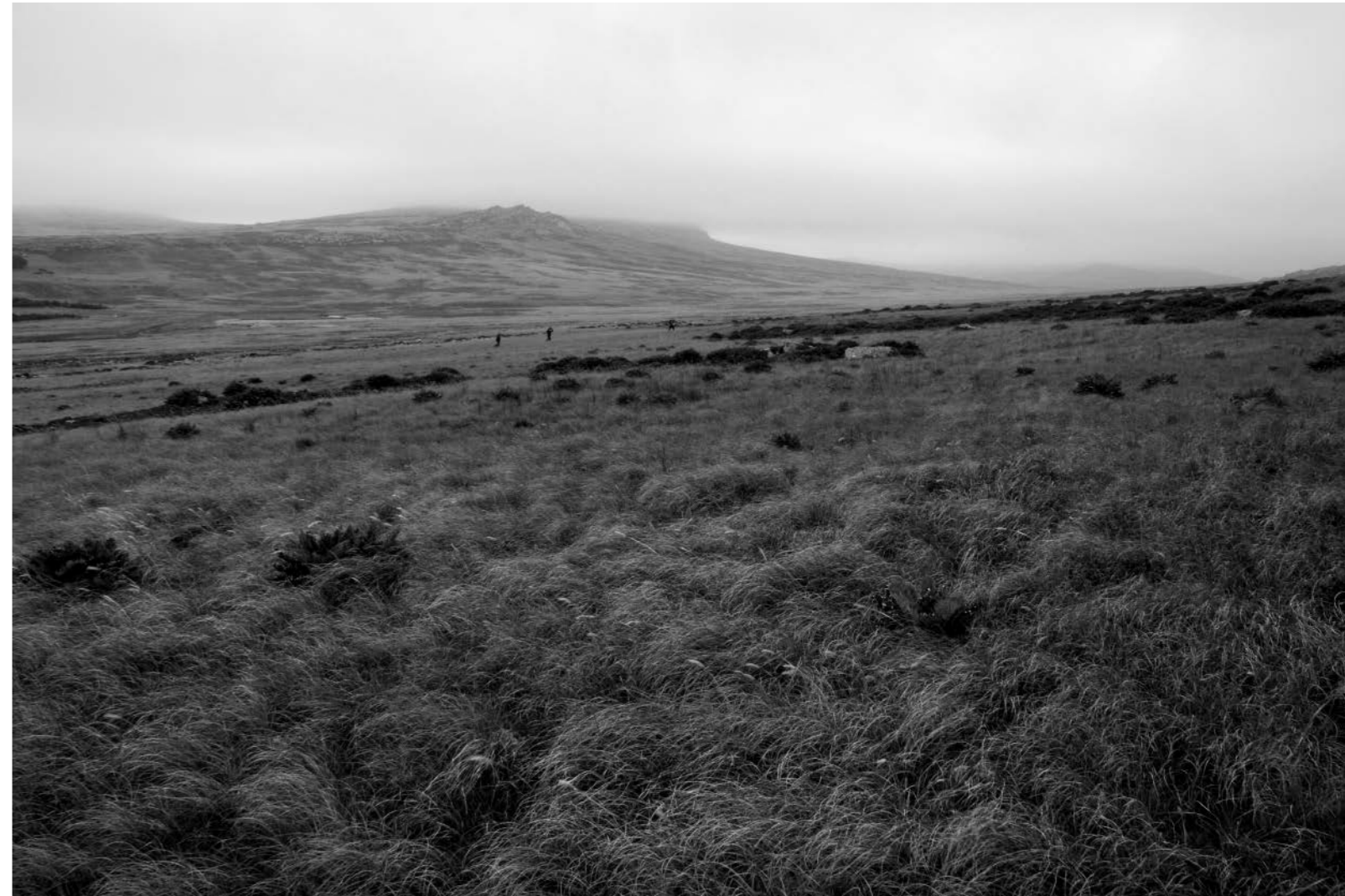
Izq. Resto de trincheras en Monte Longdon