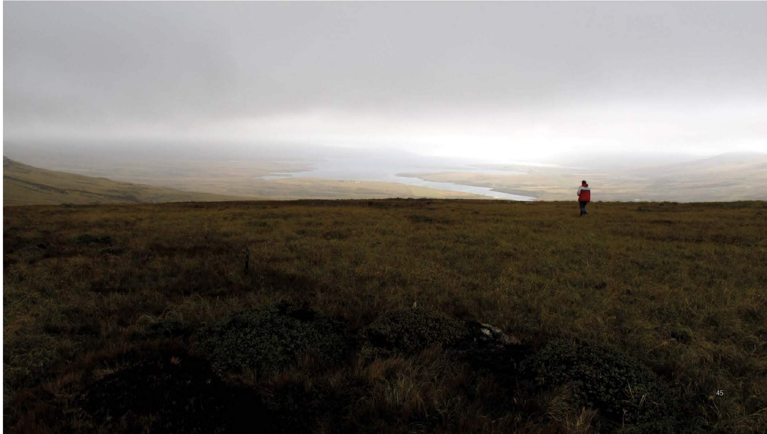
Bahía San Carlos