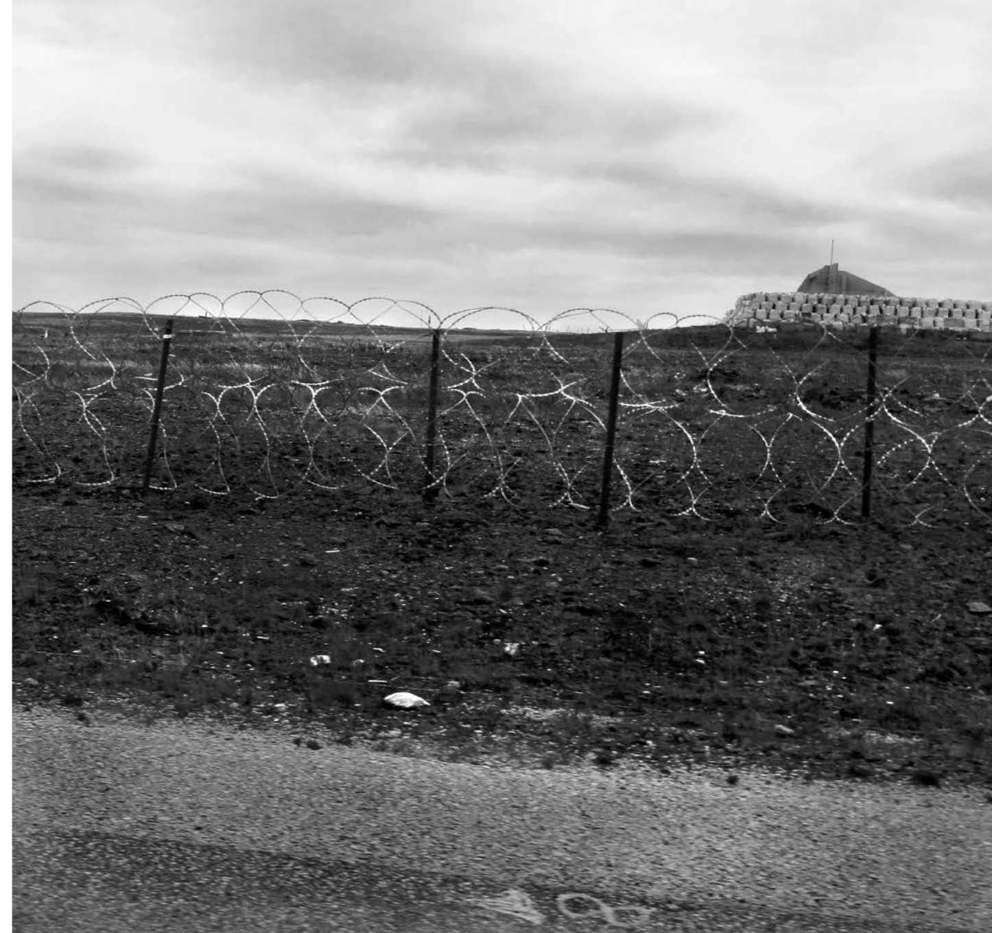
Base Militar Mount Pleasant