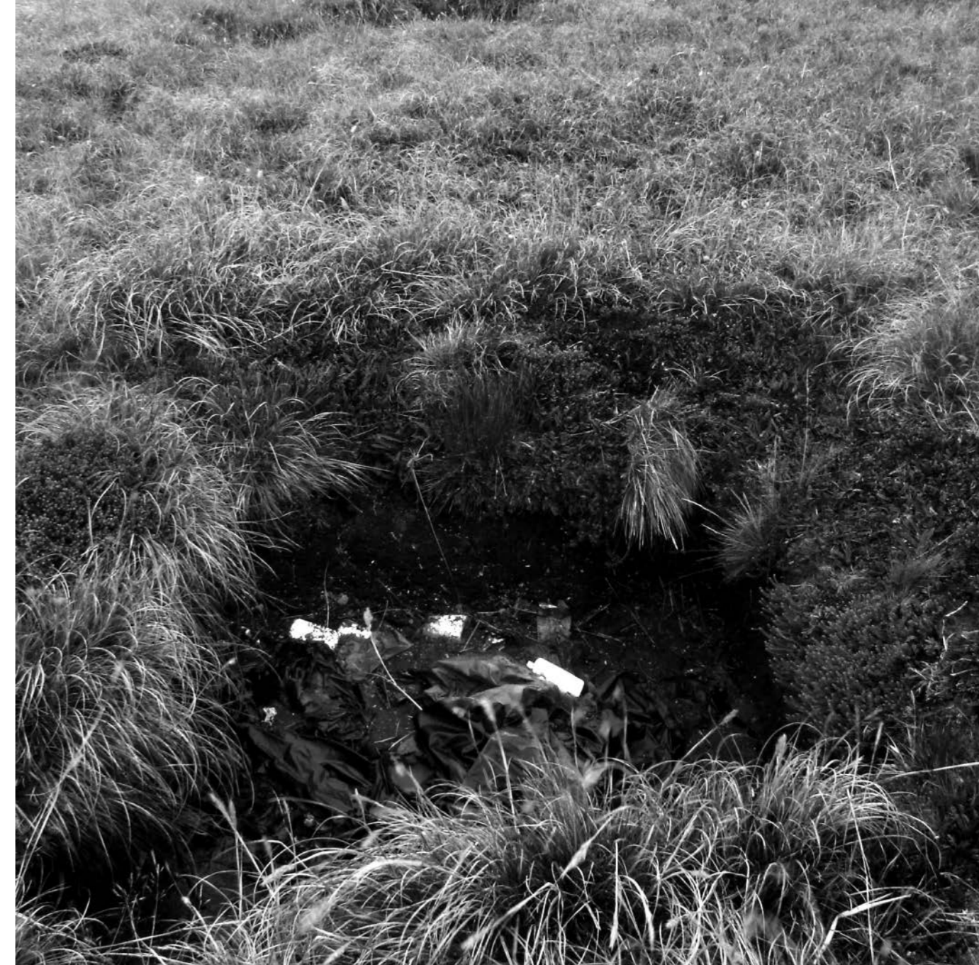
Pozo ubicado en Bahía San Carlos