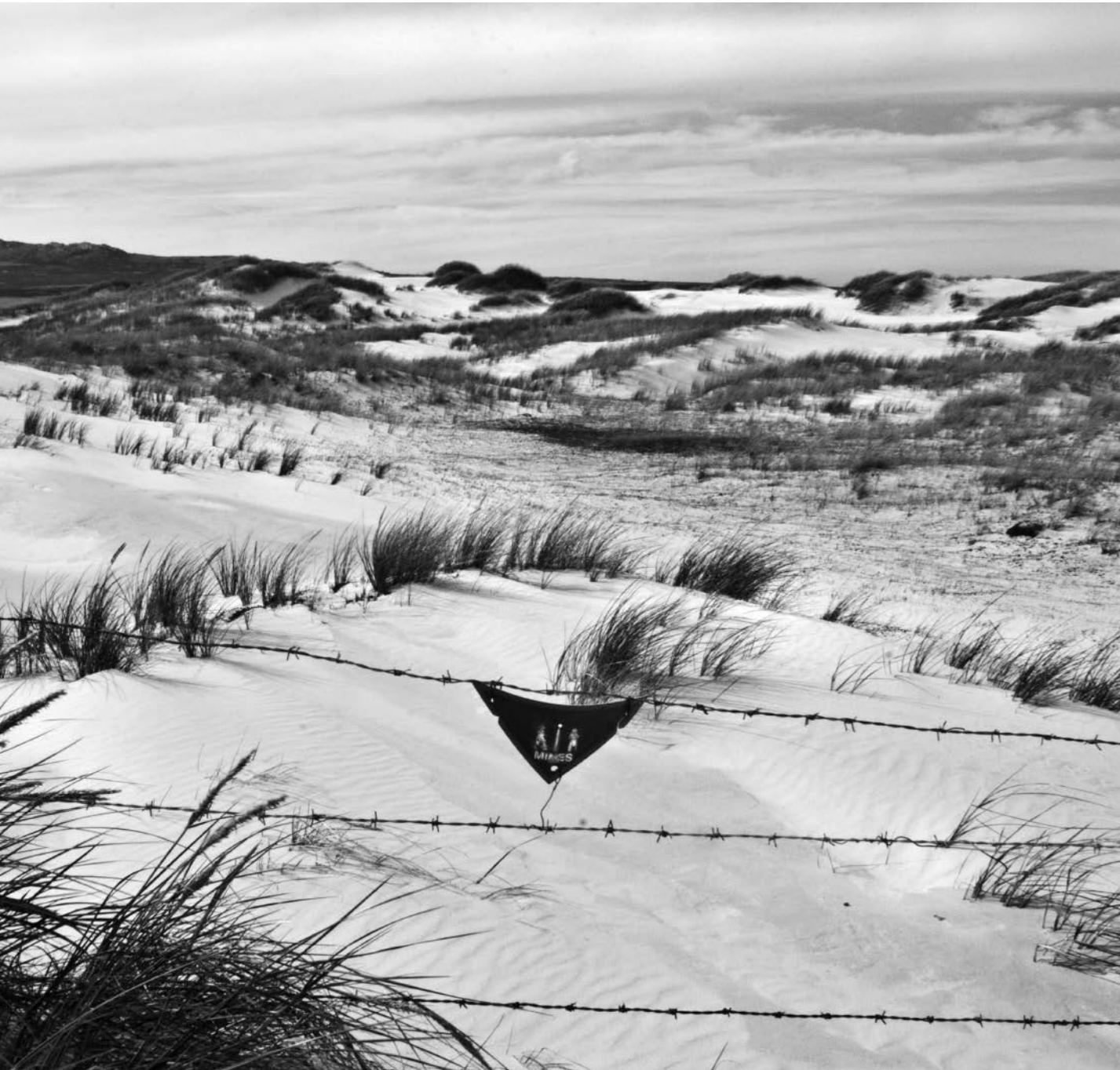
Playa Minada Gypsy Cove