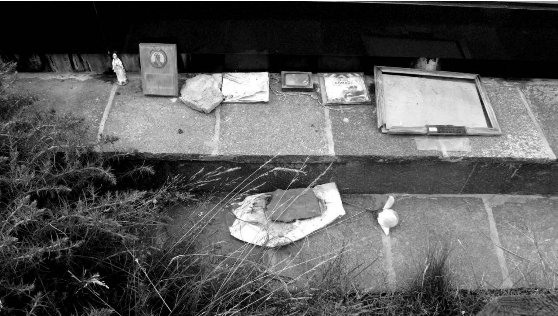
Recordatorio en el Cementerio Argentino de Darwin