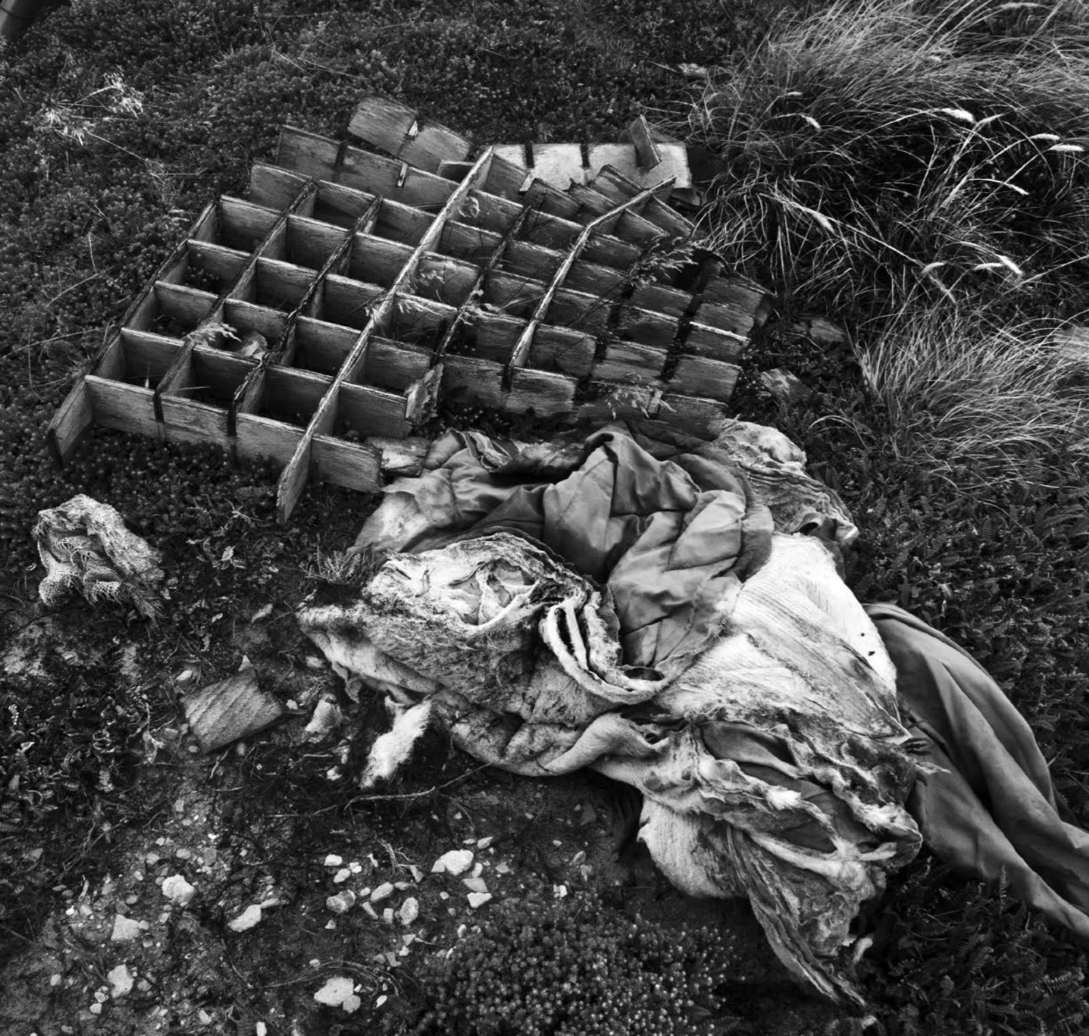
Restos ubicados en Moody Brook