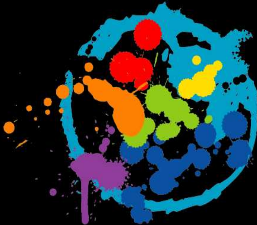
Imagen: Logo institucional de la Oficina de Inclusión Educativa de personas en situación de discapacidad de la Universidad Nacional de Córdoba.

Descripción: En un fondo negro se entrecruzan pinceladas de diferentes formas y colores englobadas en un círculo que las contiene.