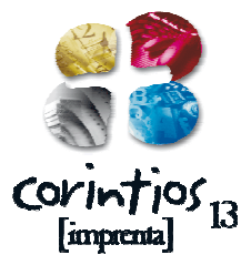
Imagen: Logo de la Imprenta.

Descripción: cuatro círculos de colores unidos por una cruz blanca.