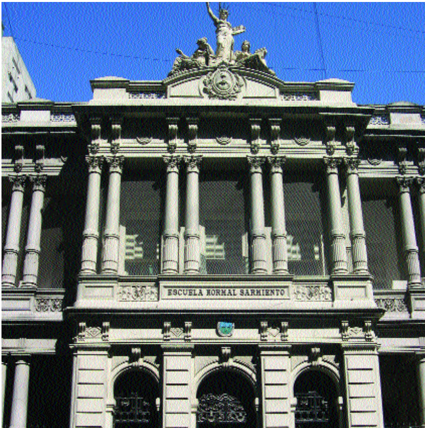
El desarrollo de la escuela como forma privilegiada de educación se relaciona con el afianzamiento de los Estados nacionales modernos.

para hacer que una población diversa y dispersa, pobre en su mayoría, reconozca y responda a la autoridad del Estado, se sienta parte de un territorio, obedezca unas leyes y