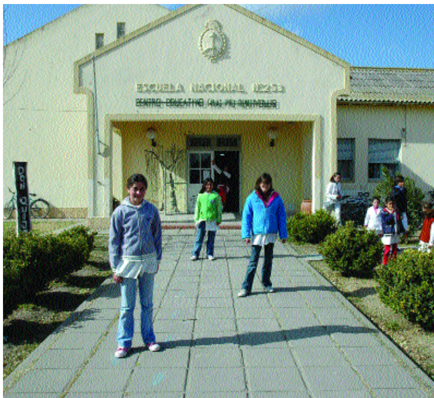
El monitor de la educación

Una constelación de elementos rodea la escuela. Los propios de su interior: el pizarrón, las tizas, los pupitres, el patio, la campana, los libros de lectura, las carátulas, los actos, la canción "Aurora", los exámenes de fin de año. Los maestros y los directores, los "inspectores" y supervisores, las porterías, los "profes" de Educación Física y de Música. Unos contenidos que enseñar, un reglamento que respetar, unas sanciones que aplicar. Un tiempo, una parte importante del día de chicos y jóvenes, que se pasa dentro de la escuela. Por otro lado, todo aquello que "la rodea": las expectativas paternas, el futuro a construir, las ganas de estudiar alguna carrera, las preguntas acerca de para qué sirve lo que se aprende en la escuela. Los compañeros, los amigos, el antes y después de la escuela en los quioscos o en la esquina. La sociedad, los