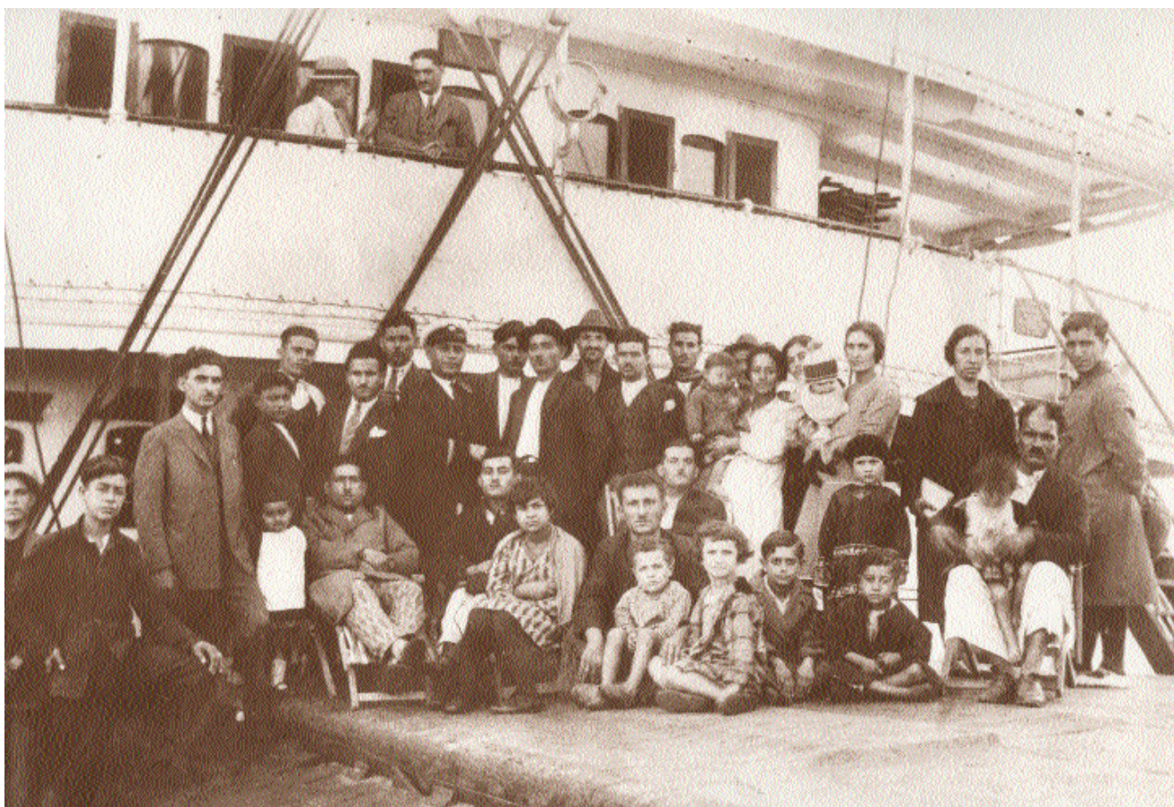
Archivo General de la Nación

Para el proyecto que llevó adelante la generación que gobernó el país hacia 1880, la escolaridad pública funcionó como un dispositivo disciplinador de los inmigrantes, de las clases populares y de los nativos.