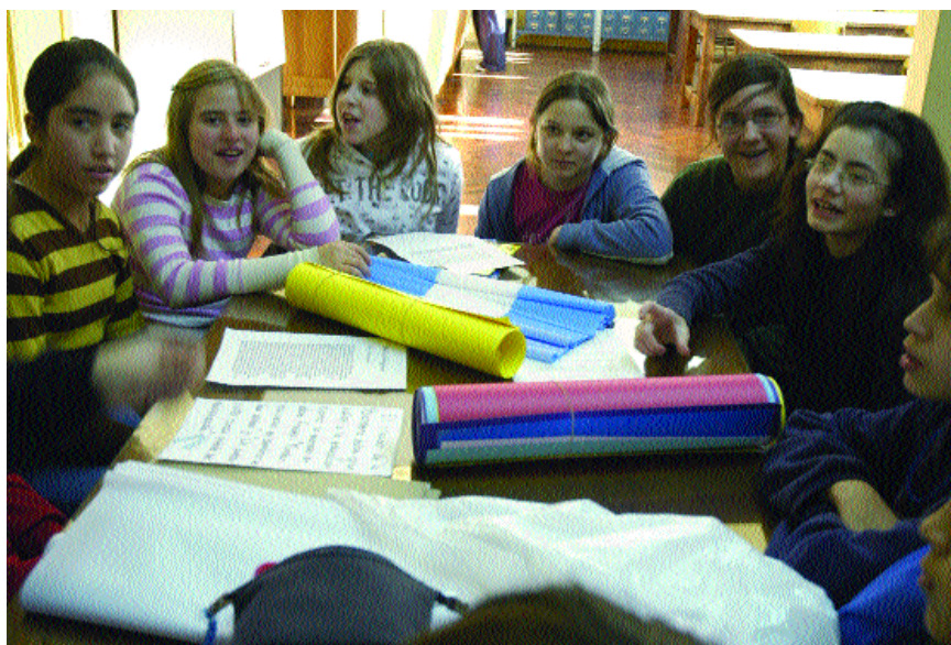
El monitor de la educación

El modo de enseñar desarrollado por las iglesias es visualizado como el más efectivo