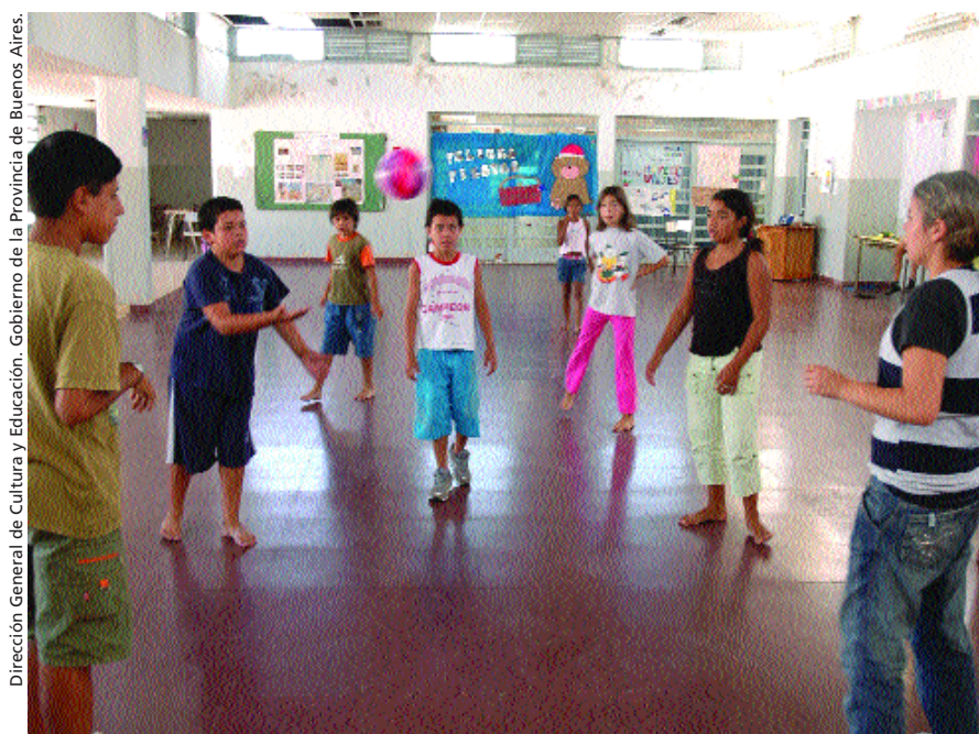
Dirección General de Cultura y Educación. Gobierno de la Provincia de Buenos Aires.

relación a las culturas de los sujetos. La apuesta por la diversidad, la tolerancia, el respeto por la diferencia, incluye un conjunto de críticas amplias, que van desde el reclamo por un currículum "multiculturalista", al respeto por las identidades sexuales y la construcción de narrativas étnicas y raciales que no sean discriminatorias. La crítica no se restringe entonces a una escuela que excluye, o a la preocupación sobre el acceso a la educación, sino que la discusión también apunta hacia el currículum escolar, los libros de texto, los rituales escolares, usualmente ordenados con la lógica de construir una identidad dominante –nacional, de raza, étnica, de género– que ubica a las demás como subordinadas. Se señala, en este sentido, que la escuela discrimina, reparte desigualmente, refuerza estereotipos, construye jerarquías entre géneros, clases y etnias, privilegia unos modos de ser hombre y mujer por sobre otros . El desafío que se le plantea a la escuela tiene que ver con cómo organizar y presentar los saberes, contenidos y prácticas escolares de modo que tengan en cuenta las diferencias y las particularidades de los sujetos, resistiendo la construcción de jerarquías culturales, de clase y de género, y de criterios de normalidad y anormalidad.