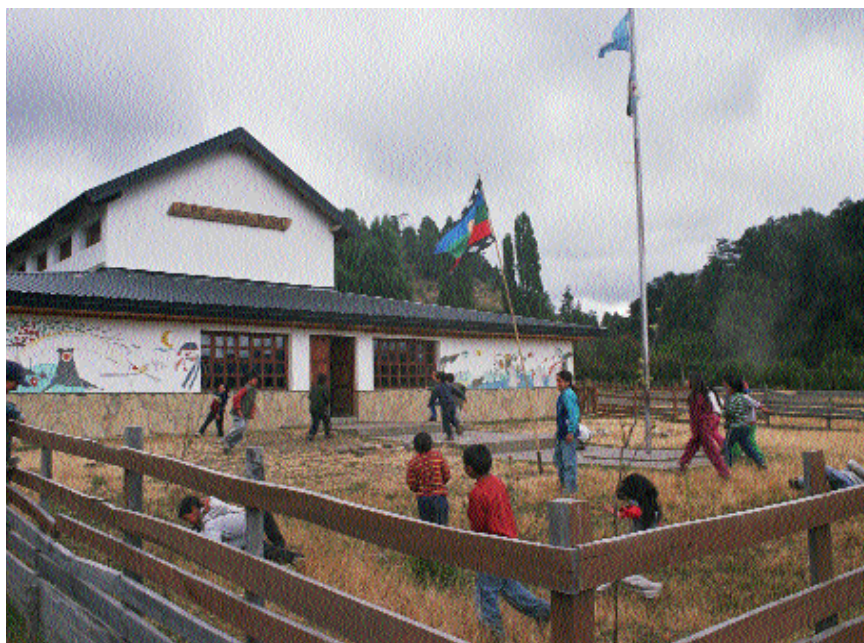
El monitor de la educación

3) Si a comienzos del siglo XX la escuela apostó fuertemente por la homogeneización de la población escolar, comenzando el siglo XXI la crítica se dirige justamente a esa operación, señalando que la escuela no respeta las diferencias entre los sujetos y no trabaja con la diversidad . La escuela moderna negó las culturas regionales, familiares, sociales que preexistían al proceso de escolarización. "Igualdad" fue en nuestro sistema educativo sinónimo de "homogeneidad", y la inclusión que la escuela produjo fue a costa de subsumir las diferencias de los sujetos en una identidad común. La crítica se dirige entonces a las exclusiones que resultaron de las formas de inclusión social que planteó la escuela, proponiendo el respeto por lo que el niño trae consigo –por su cultura, por sus códigos, por sus costumbres, por sus lenguajes– como criterio a la hora de decidir cómo y