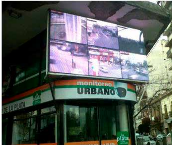
Imagen 2. Fachada del MoPU