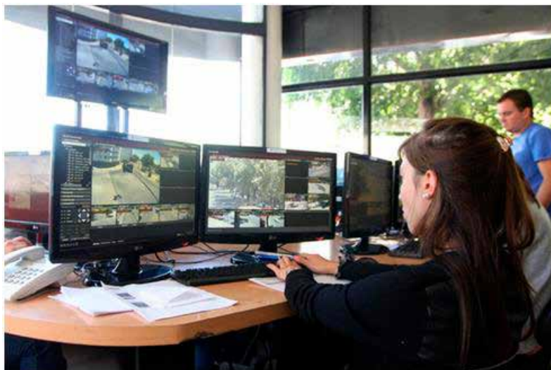
Imagen 4. Puesto de videovigilancia