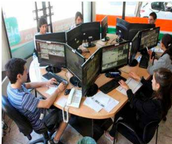
Imagen 3. Espacio de trabajo de los operadores del MoPU