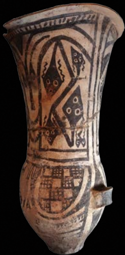
MLP-Ar-FPM-2524 CATAMARCA, ARGENTINA 74 x 40 cm. PERÍODO TARDÍO

D os urnas cerámicas de cuello largo y asas laterales con decoración pintada en rojo, ante y negro con diseños geométricos y zoomorfos. Ambas piezas provienen de contextos funerarios y fueron utilizadas para la inhumación de párvulos, que eran colocados en su interior como paso previo al entierro de la urna. Desde fines del siglo XIX y hasta la actualidad sus intrincados diseños han sido objeto de análisis y discusión entre los especialistas, existiendo múltiples interpretaciones acerca de su significado y su potencial para brindar información sobre diversas prácticas sociales.