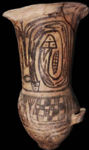
MLP-Ar-FPM-2526 CATAMARCA, ARGENTINA 60 x 36,6 cm. PERÍODO TARDÍO

D os urnas cerámicas de cuello largo y asas laterales con decoración pintada en rojo, ante y negro con diseños geométricos y zoomorfos. Ambas piezas provienen de contextos funerarios y fueron utilizadas para la inhumación de párvulos, que eran colocados en su interior como paso previo al entierro de la urna. Desde fines del siglo XIX y hasta la actualidad sus intrincados diseños han sido objeto de análisis y discusión entre los especialistas, existiendo múltiples interpretaciones acerca de su significado y su potencial para brindar información sobre diversas prácticas sociales.