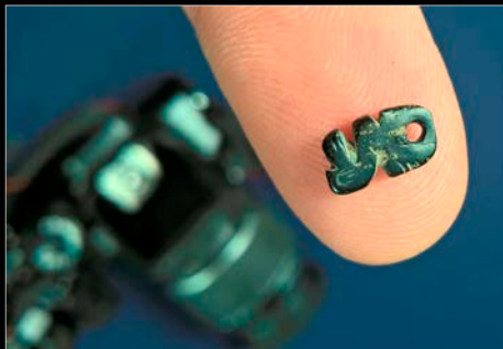
Depósito 25 Museo de La Plata La Plata, diciembre de 2025