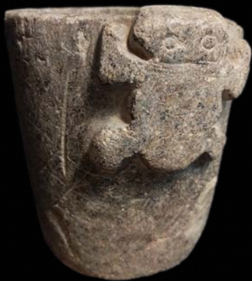
MLP-Ar-FPM-1374 VALLES CALCHAQUÍES, ARGENTINA 17 x 15 x 0,9 cm. PERÍODO TEMPRANO

D os vasos de piedra pulida con ornamentación en relieve. Uno presenta la silueta de un animal de cuatro patas y el otro una silueta antropomorfa. Ambas piezas fueron trabajadas a partir de un único bloque de piedra que fue desbastado hasta generar la cavidad interna y definir los diseños volumétricos. La imagen zoomorfa remite a un anfibio de cuerpo robusto, patas cortas, gran boca y ojos dorsalizados, mientras que el personaje del otro vaso se presenta como un individuo con tocado a modo de rodete y las rodillas flexionadas rodeadas por un brazo. Se desconoce la procedencia de ambas piezas pero ejemplares de características semejantes han sido recuperados como parte de ajuares funerarios.