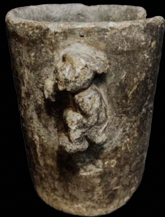
MLP-Ar-FPM-2087 VALLES CALCHAQUÍES, ARGENTINA 15,6 x 11,8 x 0,6 cm. PERÍODO TEMPRANO