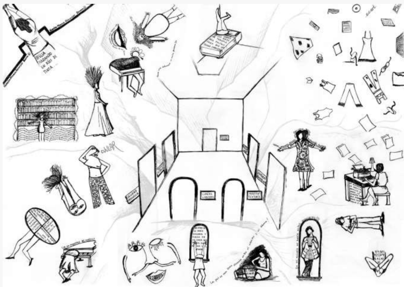
Imagen: Elizabeth López Betancourth Diseño Gráfico: Mauricio Gómez Santamaría