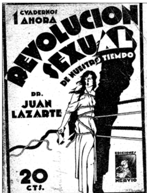
Figura 1: Tapa de la obra Revolución sexual de nuestro tiempo (1932), ilustración de José Planas.

Nos proponemos aquí analizar este evento discursivo, considerándolo parte del discurso anarquista en relación con la sexualidad, utilizando algunas de las herramientas proporcionadas por el Análisis Crítico del Discurso (ACD). 8 Podríamos haber optado por otras publicaciones u otros libros o folletos, pero siendo subjetivamente críticas, fue el que más atrajo nuestra atención por la ilustración de su portada (fig. 1).