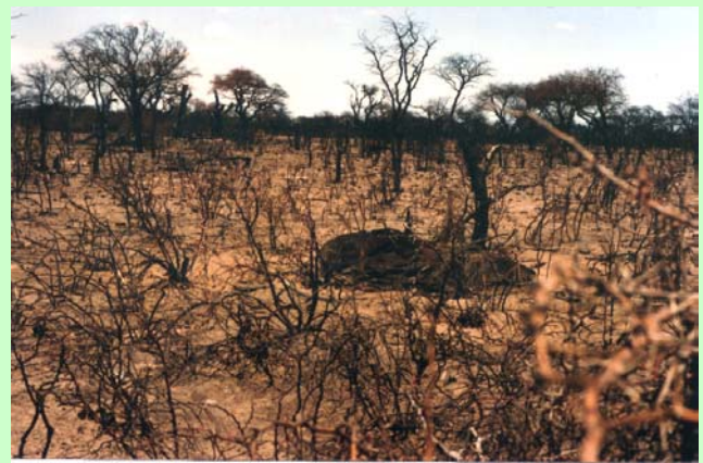
Fig 11: Archivo personal

En síntesis, la regeneración del caldén se concreta por semillas, por rebrotes y obviamente por ambas conjuntamente. Ello puede ocurrir natural o artificialmente. Estos patrones de regeneración tienen importantes implicancias para la producción y manejo.