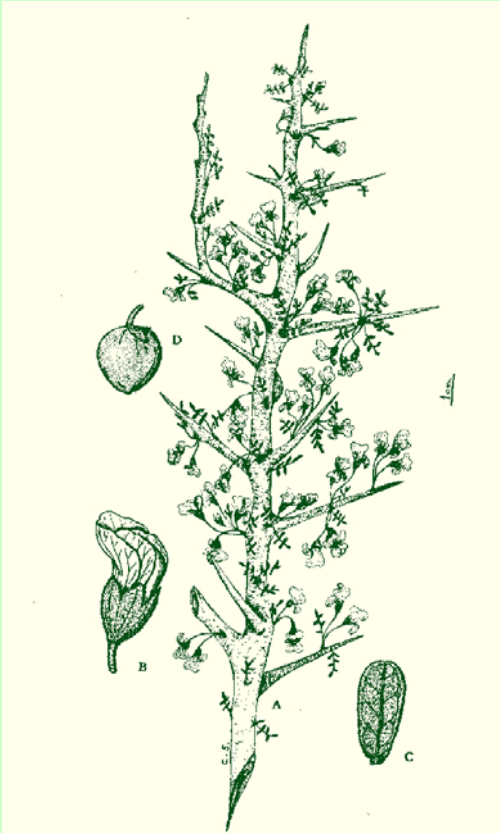
Fig 3: Ha sido tomada de “Pastizales Naturales de La Pampa”. 1988. CREA. Bs. As.

El estrato arbustivo, alcanza 1 m de altura. Está representado por el piquillín ( Condalia microphylla Cav., Rhamnacea); alpataco ( Prosopis flexuosa Dc. var. depressa F. A. Roig, Leguminosa); atamisque ( Capparis atamisquea Kunze, Caparidacea); azahar del monte ( Aloysia gratissima (Giles, et Hook.) Tronc., Verbenacea); llaollines ( Lycium chilense Miers ex Bertero var. chilense , L. chilense var. confertifolium (Miers) F. A. Barkey, L. gilliesianum Miers, Solanaceas); tramontana ( Ephedra triandra (Tul) emend J. H. Hunz., Ephedracea).