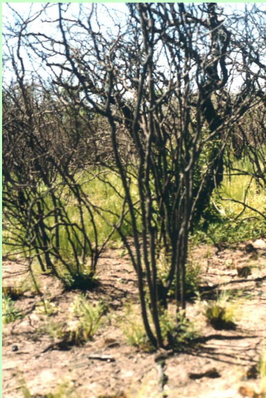
Fig 13:

frecuentemente al empleo del fuego como quemas controladas o prescriptas, cuando no ocurren incendios fortuitos, con el fin de mejorar la producción forrajera. El fuego daña la vegetación leñosa, en especial en los estados de renoval, que generalmente rebrota vigorosamente luego de la muerte, total o parcial, de la parte aérea. Cuando la masa leñosa arbórea-arbustiva reconstituye la ocupación del espacio aéreo los productores generalmente se ven impulsados a reiterar las quemas, causando un paulatino deterioro de la vegetación leñosa y del ambiente ( Lasalle, 1957 ; Lell y Alvarellos, 1999 ).