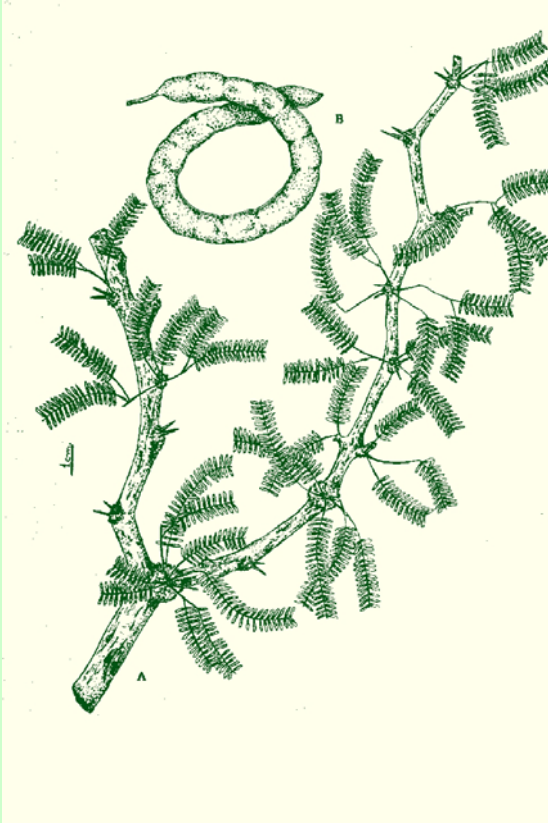
Fig 7:

Una detallada información, referente a los caracteres morfológicos de esta especie y afines, se puede encontrar en Palacios et al. (1988) .