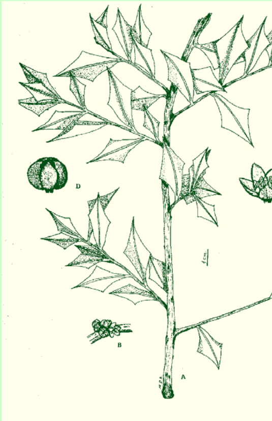
Fig 5:

ambigua Speg.), y pasto puna ( Stipa brachychaeta Godr.). Es comúnmente conocido como caldenal-pastizal (Poduje, 1987).