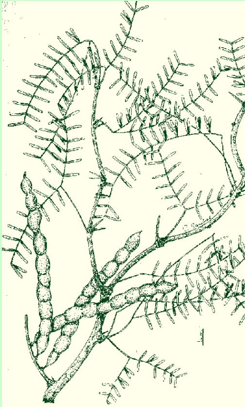
Fig 2:

marcados, de bajo a mediano contenido de materia orgánica (1,5 – 3 %). Presentan moderada a alta susceptibilidad a la erosión eólica e hídrica, que se incrementa hacia el Oeste, coincidiendo con la disminución de las lluvias ( Poduje y Lell, 1974 ).