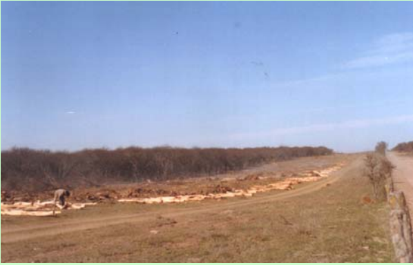
Fig 9: Archivo personal

Cuando la regeneración ha sido incompleta, en sucesivas oleadas se van ocupando los espacios en los periodos propicios de fructificación y condiciones para la diseminación e instalación de las plántulas, pudiendo ello ocurrir en 2 (Fig. 10) o más oportunidades (Fig. 11) que se evidencian por la presencia de los grupos de edades correspondientes a los distintos momentos en los que se produjo la regeneración; dando lugar a rodales dietáneos o polietáneos (Lell, 2004 en García, 2004).