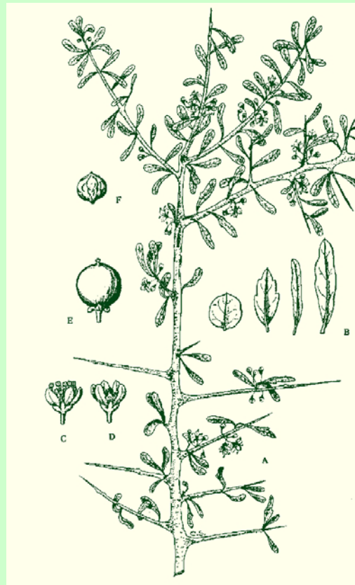
Fig 4: Ha sido tomada de “Pastizales Naturales de La Pampa”. 1988. CREA. Bs. As.

( Condalia microphylla ); manca caballo ( Prosopidastrum angusticarpum R. A. Palacios et Hock., Leguminosa); yerba de la oveja ( Baccharis ulicina Hook. et Arn., Compuesta). El estrato gramíneo tiene considerable número de gramíneas palatables, dominan las perennes, entre ellas: flechilla fina ( Stipa tenuis Phil.); flechilla negra ( Piptochaetium napostaense (Speg.) Hack.); unquillo ( Poa ligularis Nees ex Steuds) y estivales como cola de zorro ( Setaria leucopila (Scribn. et Merr.) K. Schum.); pasto cresco ( Aristida subulata Henrard); pasto de hoja ( Digitaria californica (Benth) Henrard); plumerito ( Trichloris crinita (Lag.) Parodi) (Poduje, 1987).