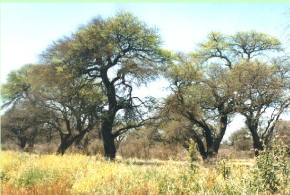
Fig. 10: Archivo personal

También, luego de talas e incendios la mayor parte de las especies leñosas que componen el caldenal rebrotan vigorosamente tras la destrucción de su parte aérea, como consecuencia el vuelo de las masas adquieren el carácter de coetáneo independientemente de la edad de la cepa dando lugar a la proliferación de varios vástagos por cepa, transformándose en una masa leñosa densa localmente designada como fachinal (Lell y Alvarelos, 1999).