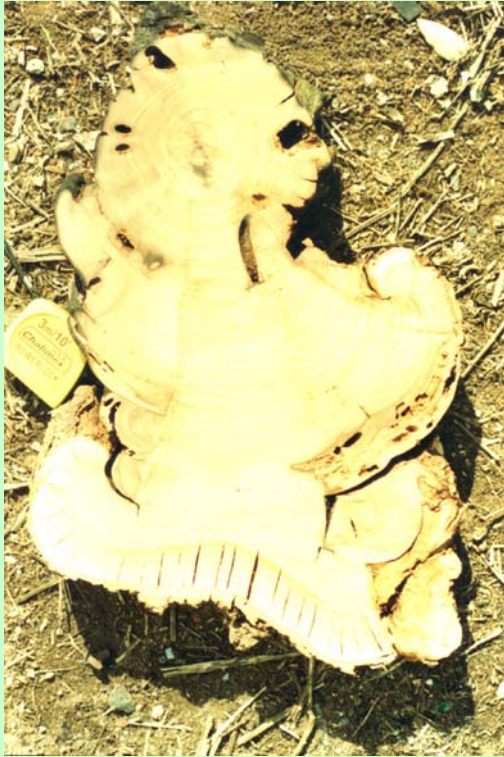
Fig 12: Colaboración de la Lic. Andrea Medina.

Medina et al. (2000) estudiaron la cronología de fuegos en un bosque de caldén del Sur de San Luis pudiendo reconstruirla para el período de 1787 hasta 1993 documentando un intervalo medio de fuego de 13,14 años para el período de ocupación de pobladores indígenas (1787-1879), de 15 años para el período de transición (1880-1910) y de 7,25 años para el período final (1911-1993). Observando que las fechas de ocurrencia de incendios en el siglo veinte coinciden, además, con los períodos de desmonte intensivo y con el comienzo del uso de quemadas intencionales en la zona. La estacionalidad de los fuegos, mayormente de primavera y verano, coincide con el período anual de mayor déficit hídrico y de mayor acumulación de material combustible en los estratos inferiores del bosque. La Tabla 2 resume el número de hectáreas de caldenal de la Provincia de La Pampa afectadas por incendios durante el período 2000 - 2002.