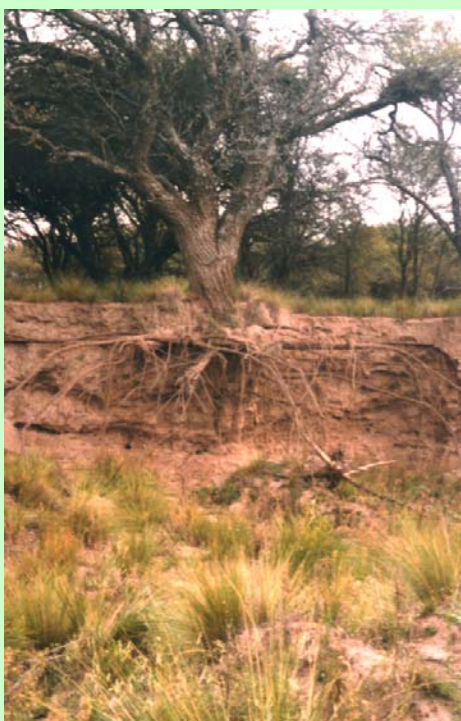
Fig 8: Archivo Personal.

Las legumbres maduras son muy valoradas por su alto valor alimenticio para el ganado. Privitello y Gabutti (1993) evaluaron la calidad nutritiva de la harina de vainas de caldén con semillas obteniendo los siguientes resultados: Materia Seca: 79,35 %; nitrógeno: 2,73 %; proteína bruta: 14,81 %; cenizas, 4,72 %; materia orgánica: 95,28 %; fibra detergente neutro o pared celular: 61 %; contenido celular: 39 %; digestibilidad materia seca ( in situ ) a las 72 h: 51,73 %; digestibilidad fibra detergente neutro: 29,6 %; digestibilidad contenido celular: 90,58 %.