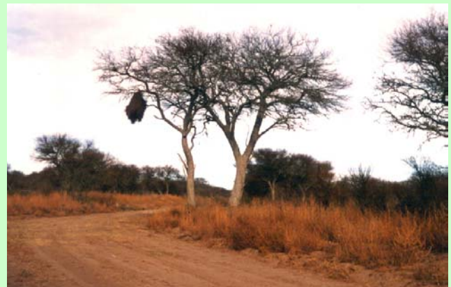
Fig 6: Archivo Personal.

En general los ejemplares tienen tendencia a ramificar a baja altura, resultando un fuste corto, poco cilíndrico; de 1 a 3 m de longitud -Fig. 6-. Existen ejemplares cuyo DAP es superior a 1,5 m. Suelen presentarse bifurcados desde el suelo, lo que Lasalle (1966) considera atribuible al nacimiento y unión posterior de 2 o más plántulas nacidas de semillas de una misma chaucha. También he observado tal situación a rebrote de tocones bajo el nivel del suelo luego de la muerte de la parte aérea de la planta por incendios o cortas.